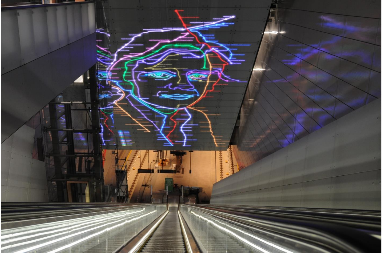
Ramses Shaffy, Levenslijnen in Metrostation Vijzelgracht, 2016, 24 x 13 meter, LED-verlichting.

maakt veelal voor langere tijd op een plek aanwezig blijft, waardoor het een verbinding met de locatie en de mensen daar krijgt.